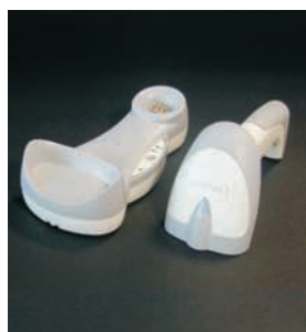
Im Uhrzeigersinn: Stand-, Tisch- und Wandhalter für den Gryphon™